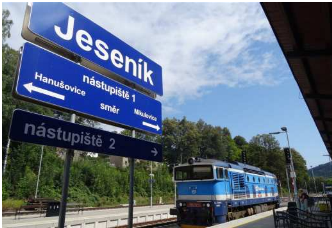
Železnici čeká s koncem prázdnin tradiční nápor cestujících.