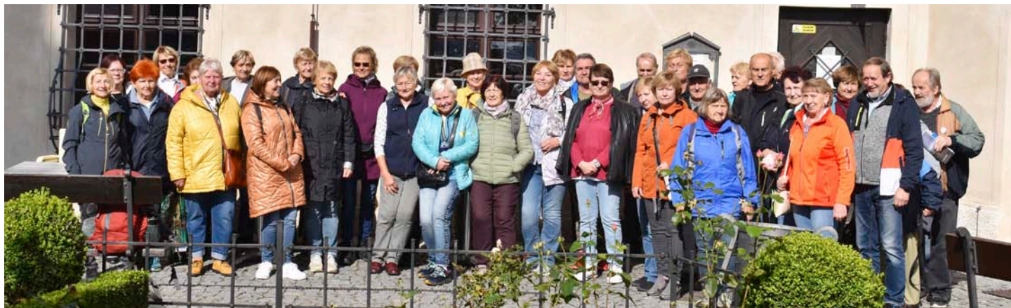
Senioři OHLA ŽS jsou aktivní cestovatelé

něk hrabě Sternberg. K trvalému obývání byl upraven až ve 20. století Jiřím hrabětem Sternbergem. Byl zde zaveden vodovod, elektrické osvětlení a prázdné prostory byly naplněny mobiliářem a sbírkami artefaktů. Hrad odolal i německé okupaci, kdy na něj byla uvalena nucená správa. Po válce byl sice navrácen majitelům,