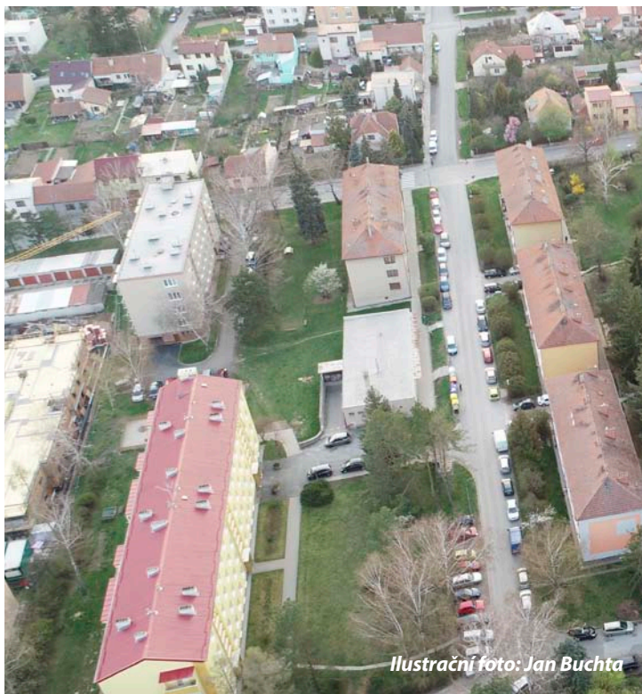
Ilustrační foto: Jan Buchta

vení nastane již ve druhé polovině příštího roku. Nicméně za zaznamenání stojí názory, že ochlazení přetrvá až do počátku roku 2024. Nemovitosti se vždy vrátí k růstu. Investoři se tak vedle lákavých výnosů z pronájmů, které navíc stále rostou, téměř jistě dočkají budoucího zhodnocení.