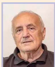
Připravil Miroslav Novotný

Závěrem setkání byly schváleny termíny jednání NeRV OSŽ v roce 2023 a spolu s tím i výjezdní jednání, které bude pravděpodobně v hotelu Ostrý v Železně Rudě, a to z důvodu seznámení členů NeRV OSŽ s nově zrekonstruovaným objektem.