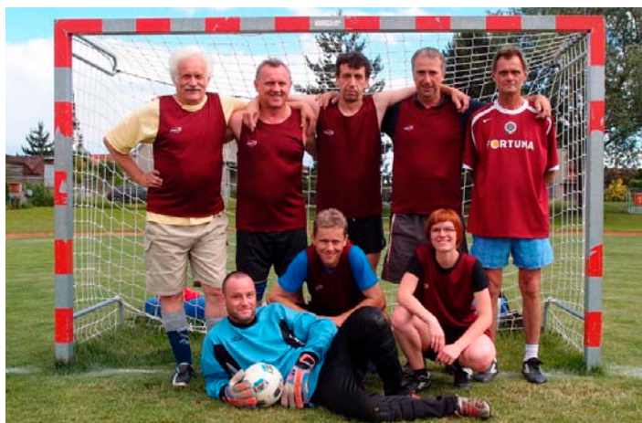
Mladým hráčům 4.ročníku v malé kopané na hřišti SŠLCh v Olomouci zdatně sekundovali i pedagogové, ani blízcí se bouře nikomu nevadila (horní snímek vlevo) Po slavnostním stužkování na maturitním plese trval taneční rej maturantů až do pozdních hodin