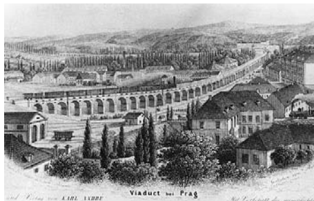
Negrelliho viadukt v Karlíně, lepta, 1854

Velkou tragédií byl smrtelný úraz významného českého inženýra Jana Pernera, stavbyvedoucího první české parostrojní dráhy, který se 9. září 1845 vracel z cesty na Moravu v prvním voze vlaku. Při výjezdu vlaku z choceňského tunelu sestoupil na nejnižší stupínek schůdků a ohlédl se zpět, při tom narazil horní částí hlavy na sloup vrat u vjezdu na nádraží. Byl sražen k zemi. S otřesem mozku a poraněnou rukou se sám zvedl a neuposle-