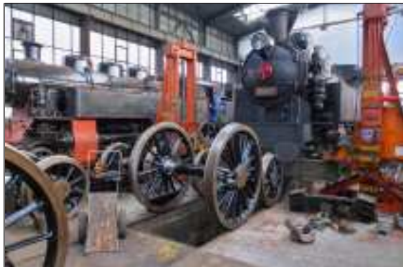
Díky šikovným rukám zdejších pracovníků se bude moci parní mašinka „Všudybylka“ 354.195 po opravě pojezdu vrátit opět brzy na koleje. K radosti (nejen) malých obdivovatelů naší železnice.

Po trase Louny – Žatec – Lužná a zpět se vypraví dne 28. 5. parní vlak na