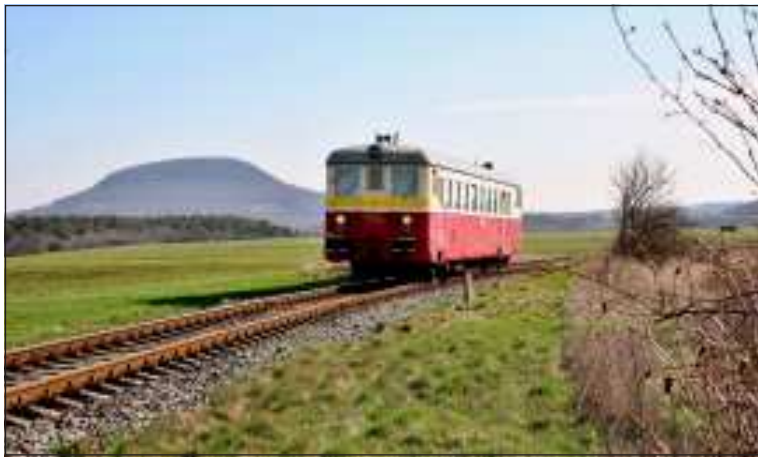
Fotografický objektiv zachytil Podřipský motoráček na pozadí památné hory Říp (455,5 m n.m.) u železniční zastávky Račiněves dne 28. 3. krátce po desáté hodině.