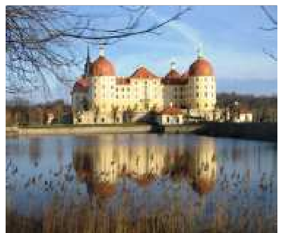
Pohled z autobusu na zámek Moritzburg.