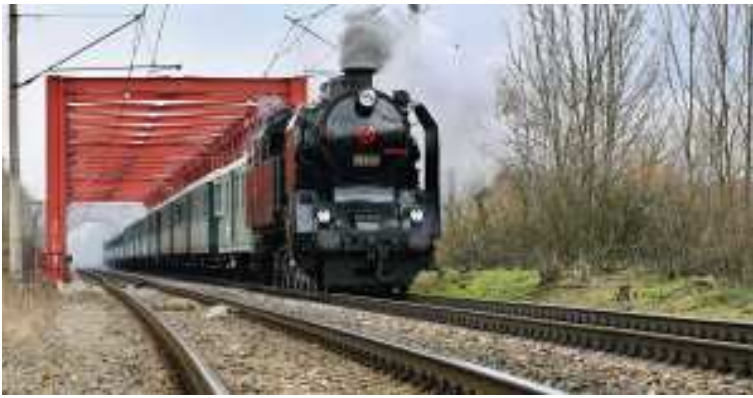
Na parní vlak v čele s „Bulíkem“ 464.008 jsme si s fotografickou kamerou počkali v sobotu 26. 3. u mostu přes Berounku v Černošicích–Mokropsech. Z důvodu výluky jezdily ve směru od Prahy vlaky mezi Radotínem a Dobřichovicemi po nesprávné koleji.

Na účastníky parní jízdy čekal opět na hradě bohatý program, který zde probíhal již od pátku. Letošní program na hradě je věnován především 700. výročí narození českého krále a císaře Svaté říše římské, Karla IV. (1316–1378). Jako vždy byl velký zájem o Velikonoční jarmark se spoustou stánků a s ukázkami starých řemesel. Ani tentokrát zde nechyběly rozliční kejklíři, komedianti a šermíři. Historickou atmosféru dotvářely pak zvuky středověké hudby. Účastníci parní jízdy měli, po předložení jízdenky, slevu na vstupném do hradu. A tak se jistě žádný z malých i velkých návštěvníků na hradě nenudil. V neděli všem přálo navíc i krásné, slunečné jarní počasí. V odpoledních hodinách