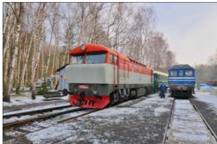
Dne 8.3. jsme v areálu železničního muzea zastihli „v akci“ stroj T 478.1004.