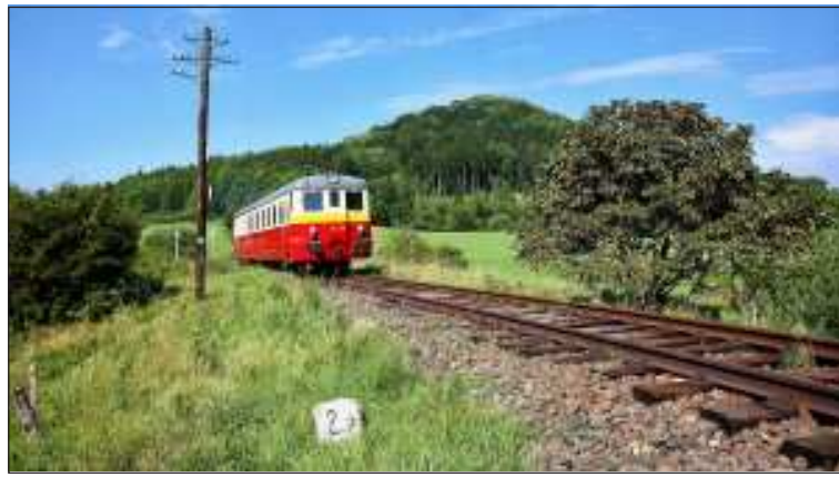
Na ilustračním snímku zachytil fotografický objektiv dne 30. 8. 2015 pod Zámeckým vrchem na cestě z České Kamenice do Kamenického Šenova „Kamenický motoráček“.