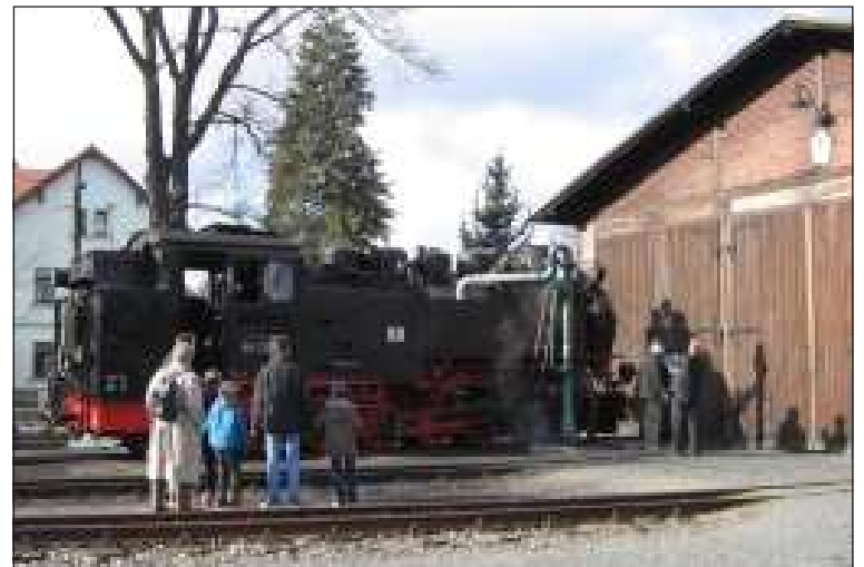
V konečné stanici Radeburg zbrojí vodu parní lokomotiva 99.1762–6, vyrobená v Berlíně (BMAG) v roce 1933.