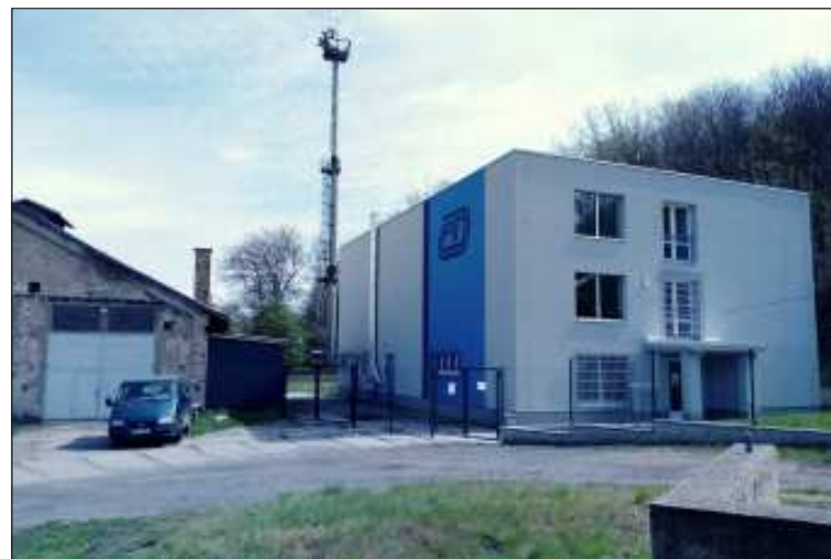
Ústřední technická knihovna ČD, mekka železničních historiků je nyní v Kralupech nad Vltavou na okraji rozpadajícího se depa, budova depa vlevo je našťastí ještě využívána pro odstávání motorů řady 809.