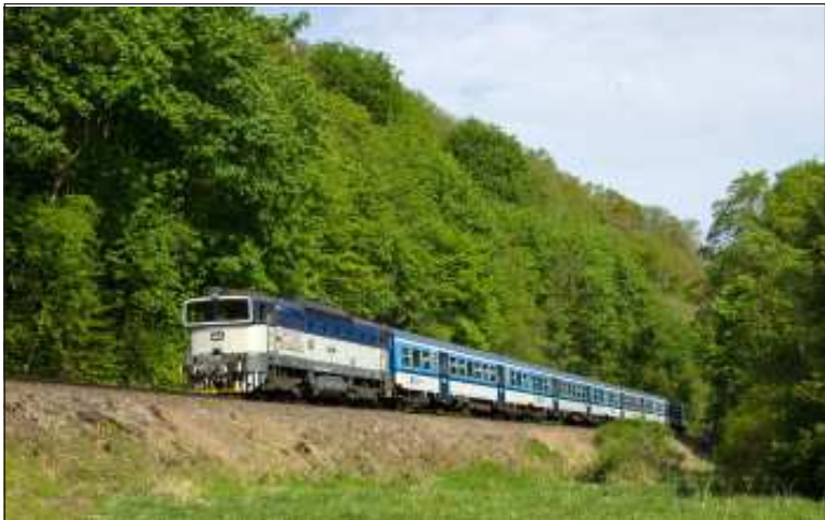
Osobní vlak 9211 „Posázaví“ projíždí po trati 212 mezi zastávkou Zlenice a stanicí Hvězdonice kolem zbytků zříceniny městečka Odranec.