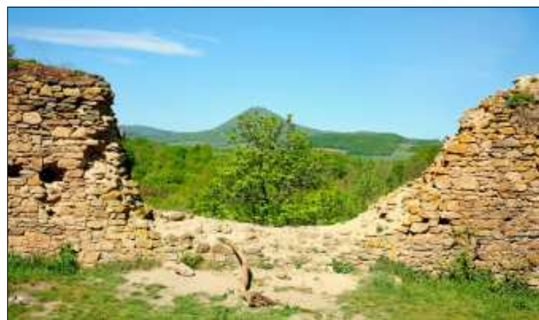
Pohled z hradu Oparno na královnu Českého středohoří Milešovku, 837