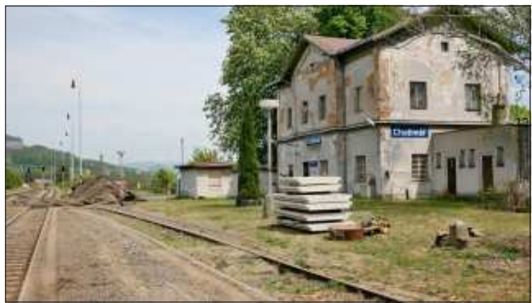
V současné době finišují práce ve stanici Chotiměř. Probíhá úprava kolejí a na budově se objevily tabule s názvem stanice.