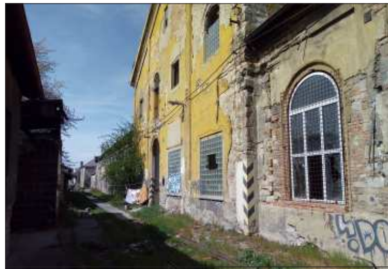
Ruina věhlasného depa Kralupy nad Vltavou, kde byla v nedávné minulosti dokonce vyměněna okna za plastová. Není možno najít pro budovy využití? To se radši vše zboří?

Ústřední technickou knihovnu pamatují ještě v 80. letech v Hyberské ulici, naposledy byla umístěna v Nákladovém nádraží Praha–Žižkov, po vymístění knihovny ze Žižkova našla útočiště v Kralupech nad Vltavou, nepřilíš vzdálených od hlavního města Prahy. Taktéž si