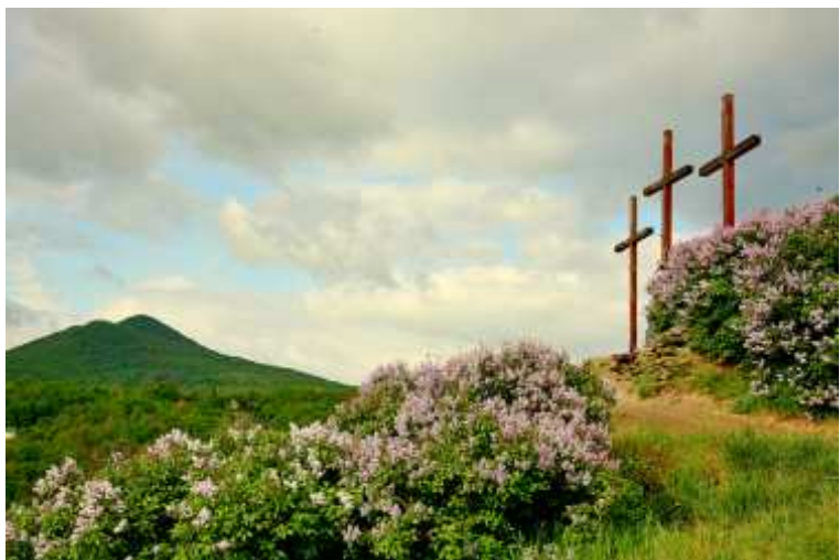
Tři kříže na vrcholu Kalvárie připomínají dle legendy tři nešťastné panny, které se vrhly se skály dolů.