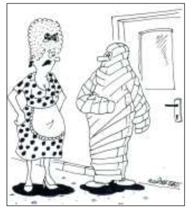
„Viš, Karle, jestli ty to s těma rouškama už nepřeháníš!“

Víte, jak ajták pozná, že venku na horách za oknem hustě sněží? Zpomalí se mu víří připojení.