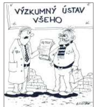
„Nemusíte mít strach, váš test na COVID je negativní, a co se týká vašeho testu na IQ, tam vám vyšla zmrzlá makrela.“ Kreslené vtipy Antonín Klech

Doktor povídá ženě pacienta: „Milostivá, váš pan manžel se mi vůbec nelíbí.“ „Mně taky ne, pane doktore, ale je hodnej na děti.“