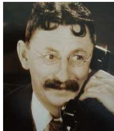
Legendární český herec Vlasta Burian (snímek převzat z Wikipedie).