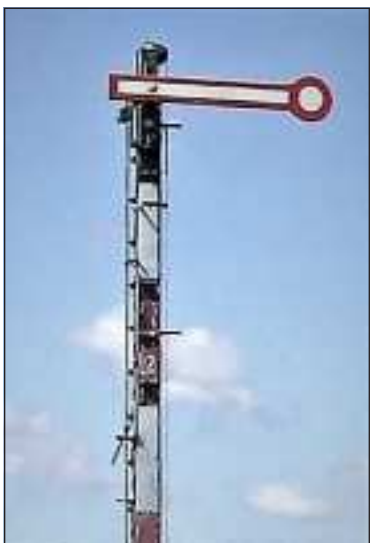
Ilustrační snímek archiv autora.

Alespoň jedenkrát v roce za ním zajedu, zavzpomínám si s ním a trochu i popovídám.