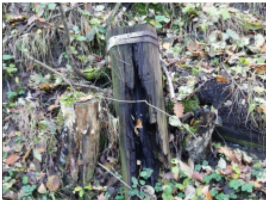
Během procházky můžete narazit na drážní artefakty, třeba na kus uhlího dřevěného pražce.

Na mšenském zhlaví dopravní Lhotka u Mělníka (trať 076) odbočovala až do sedmdesátých let minulého století krátká, zhruba tři kilometry dlouhá odbočka do Střednice. Dnes se můžete po bývalé trati projít, nebo i projet na kole (vede po ní cyklotrasa 203 ze Lhotky do Mělníka). Po bývalém drážním tělese půjdete, za stálého stoupání místy dosahujícího hodnoty až 25 promile, přibližně dva kilometry (od silnice do Kokořínského dolu po silnici do obce Vysoká), ale stojí to za to!