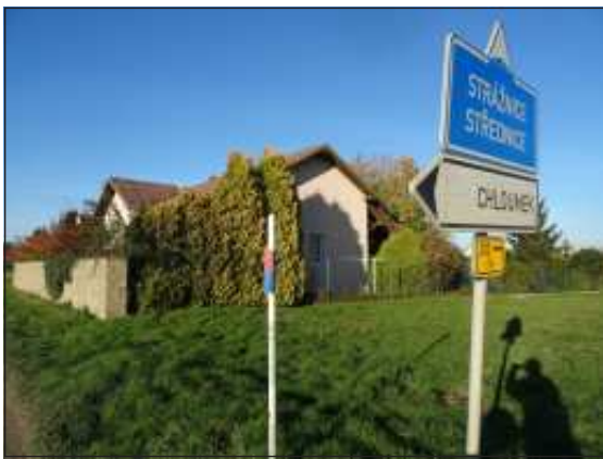
Na okraji obce Střednice je zachováno původní nádraží.