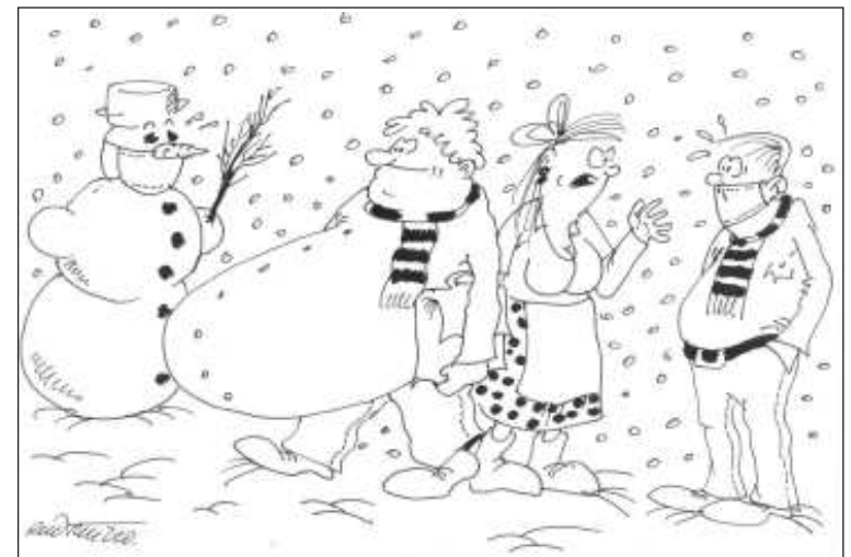
„Manžel roušku nenosí, drží si dvoumetrový odstup.“