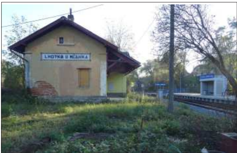
Dopravní Lhotka u Mělníka je dnes obyčejnou zastávkou s typizovaným přístřeškem.