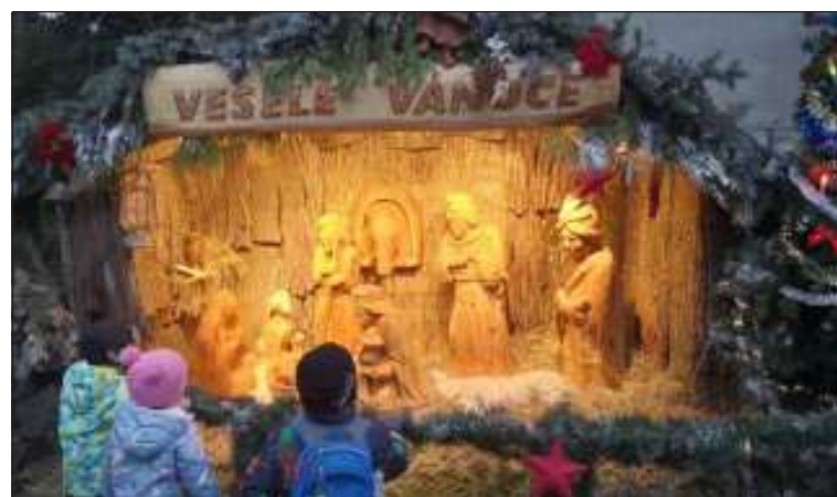
Strančický betlém je v neustálém obležení malých i velkých obdivovatelů.

Michael Mareš s využitím reportáže v Událostech ČT 29. 11. 2020