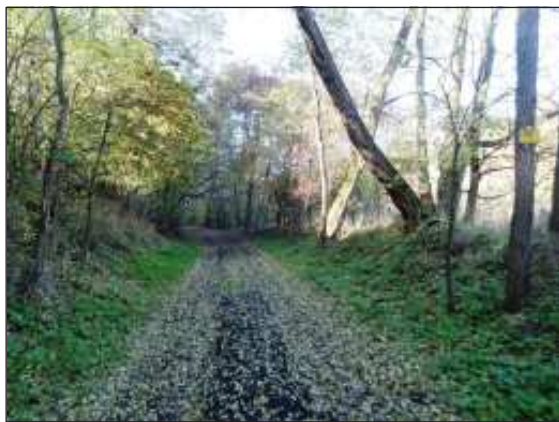
Po bývalém drážním tělese se můžete dnes projít.