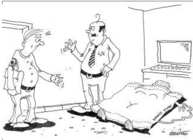
„Neděste se, doktore, manželka si jen koupila XXL roušky na internetu.“

„Žádné dárky k Vánocům mi kupovat nemusíš,“ oznamuje ženě na začátku prosince pan Vaněk. „Stací, když mne budeš milovat a budeš mi věrná.“ „Pozdě,“ povzddechla si ženuška, „já už jsem ti koupila kravatu.“