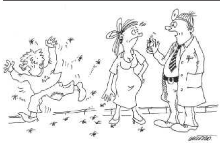
„Můžete být klidná, paní, váš kluk nemá COVID 19, ale zatraceně velký štěnice!“

Dva policajti lezou přes zed. První policajt nemůže přelézt a zakřičí na druhého: „Prosím, udělej mi kozu!“ „Mééééé!“