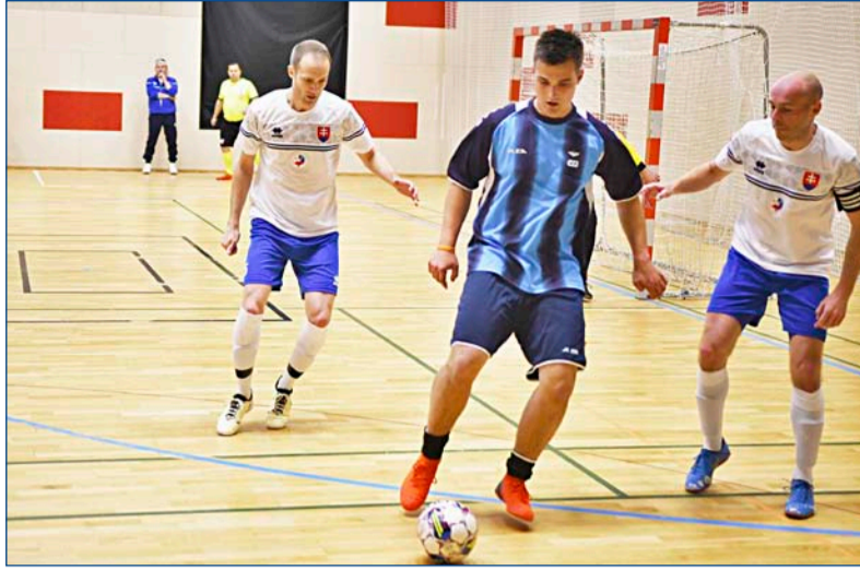
Momentka z finálového zápasu Slovensko-Česko

Prošel jsem všechny knižní sklady, pár slov si vybral, pár jich škrt, a zbyla tři bez větší vady – a to jsou ŽIVOT, LÁSKA, SMRT. Jiří Dědeček