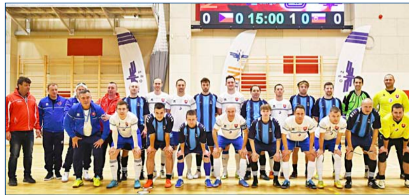
Slovenské a české mužstvo před závěrečným zápasem