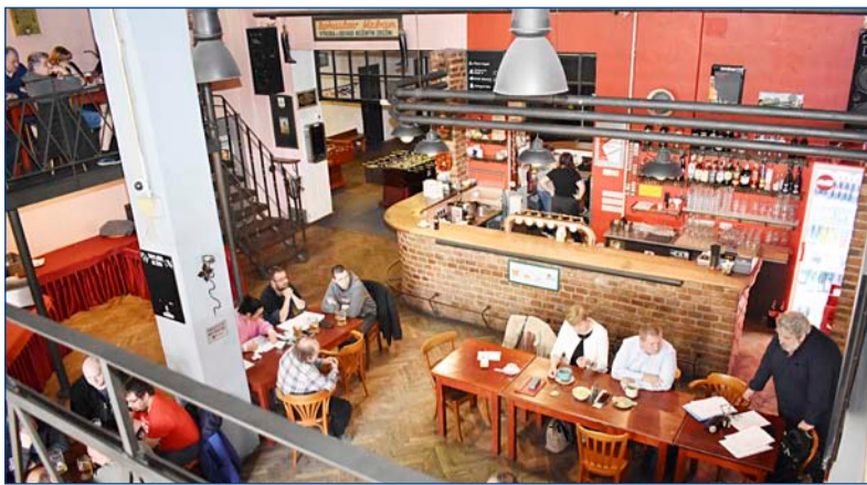
Konference ZO OSŽ DKV Praha se konala v pražské restauraci Bowling v továrně