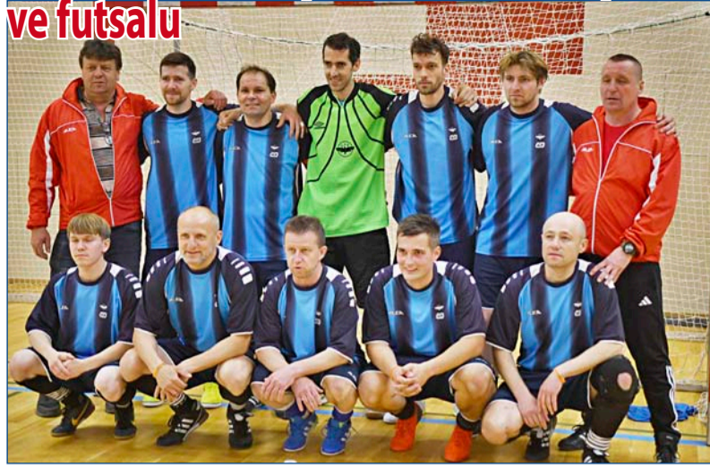
Reprezentanti OSŽ České republiky