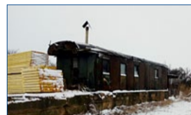
Bývalé nz. Bříza, nákladková kolej vytržena po roce 2000, odstavené torzo vozu dřevák (Ci) jako kancelář výroby palet, bylo provozní ještě do února 1990