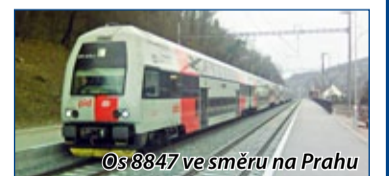
@s8847 ve směru na Prahu