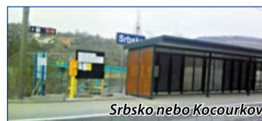
Srbsko nebo Kocourkov