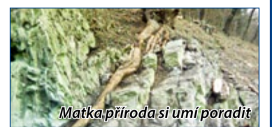
Matka příroda si umí poradit