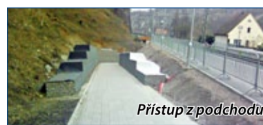
Přístup z podchodu