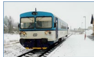
Bývalá žst. Roudnice nad Labem-Hracholusky, do roku cca 2003 zde odbočovalo několik vleček, vše je vytrháno, budova se však konečně opravuje