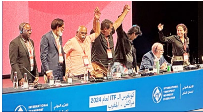
Foto z volby vedení Železniční sekce ITF na kongresu v Marrákeši v říjnu 2024

Po odchodu hostů pokračovali jednotliví předsedové Výborů OPŘ o postupu při ukončení pracovních poměrů na jednotlivých střediscích. Zatím vše probíhá bez větších komplikací. Nedostatek zaměstnanců se však začíná (Pokračování na str. 2)